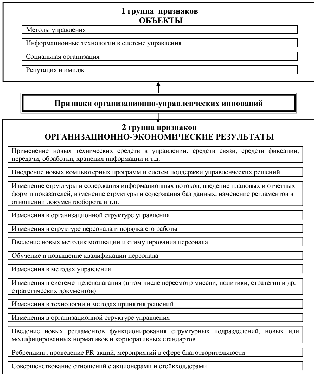
Рис. 1. Признаки отнесения инноваций к организационно-управленческим [2].

интеграции. Топологическая интеграция предполагает объединение проектных, общестроительных, специализированных, комплектующих, монтажных и пусконаладочных подразделений. При этом достигается интеграция управленческих функций и задач стратегического планирования, материально-технического снабжения, управления научно-техническим прогрессом и т. п. К топологической интеграции относится также интеграция внешняя – взаимосвязи организационной системы с поставщиками материалов, транспортными организациями, заказчиком, поставщиками оборудования. Целью такой интеграции является создание в системе рациональных материально-технических взаимосвязей.