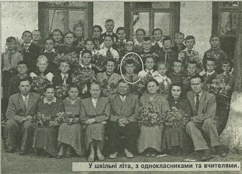
У шкільні літа, з однокласниками та вчителями.