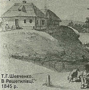
Т.Г.Шевченко. В Решетилівці. 1845 р.

Олексій ДМИТРЕНКО, лауреат Національної премії України імені Тараса Шевченка